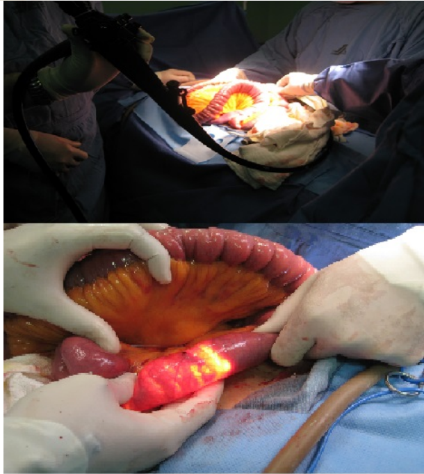
Figura 1: Endoscopia transoperatoria del intestino delgado.

fibras, sin embargo no hay un consenso acerca de la longitud de la miotomía, lo que además, constituye la más frecuente causa de falla del tratamiento al realizar una miotomía incompleta, hemos realizado la EGITO en 32 pacientes con acalasia y en 8 (25%9 de ellos se requirió de ampliar la miotomía (Figura 2).